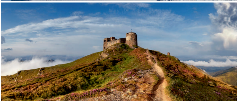
Stare polskie Obserwatorium Astronomiczno-Meteorologiczne na Pop Iwanie, znane jako „Biały Słoń”, zbudowane w 1938 roku na wysokości 2028 m n.p.m. Było wówczas jednym z dwóch najnowocześniejszych wysokogórskich obserwatoriów w Europie. Obecnie jest odbudowywane.