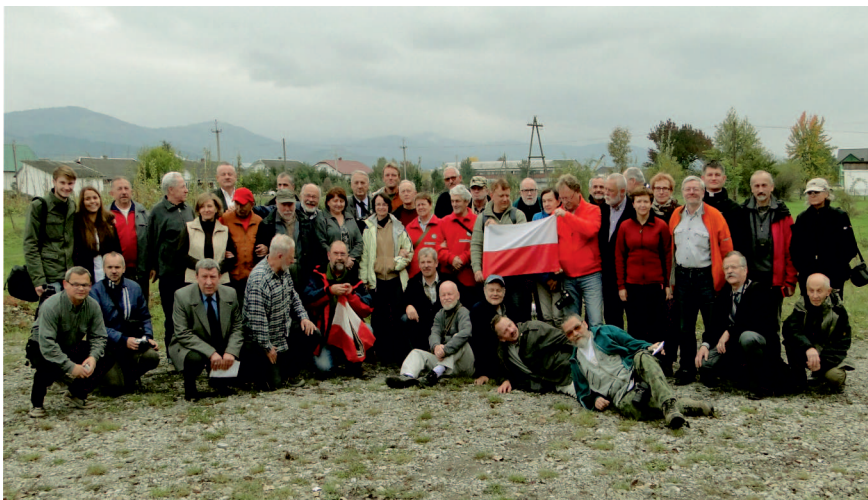
Uczestnicy obchodów jubileuszu stulecia walk Legionów Polskich w Karpatach Wschodnich w Nadwórnej, 2014 r.

Kultury odbyła się trwająca dwa dni sesja historyczna poświęcona dziejom wschodniokarpackich walk Legionów Polskich. Uczestnicy złożyli także wiązanki i zapalili znicze pod wszystkimi pomnikami i na wszystkich mogiłach legionowych w dolinie Bystrzycy Nadwórniańskiej, a także pod krzyżem na Przełęczy Legionów.