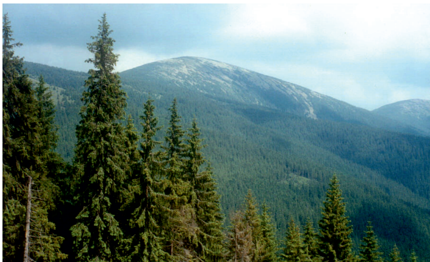
Gorgany'88. Sywula, widok z Kruhlej