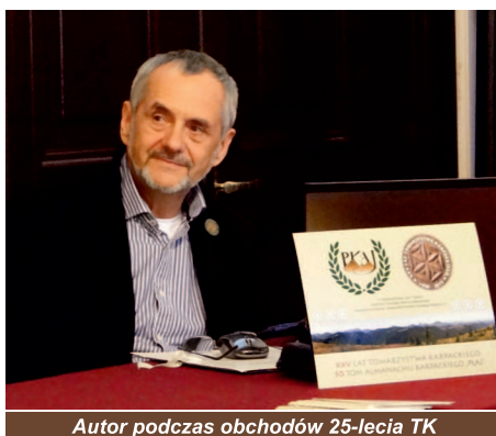
Autor podczas obchodów 25-lecia TK

Towarzystwo Karpackie powstało i zostało formalnie zarejestrowane w 1990 r., ale tak naprawdę to istniało w pewien sposób już jakiś czas wcześniej. Była nim bowiem — oczywiście nieformalnie i niejako potencjalnie — Komisja Wydawnicza Studenckiego Koła Przewodników Beskidzkich, która mniej więcej od połowy lat 80. mocno się z Koła alienowała. Wynikało to z różnych przyczyn, przede wszystkim