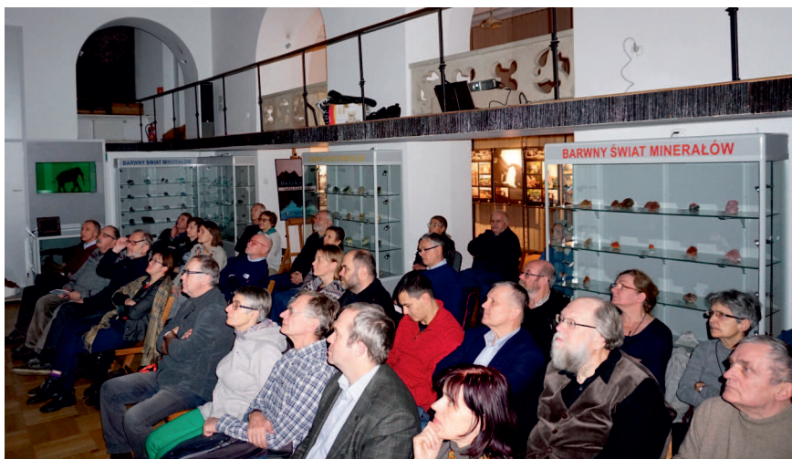
Uczestnicy jednego ze Spotkań Karpackich w Muzeum Ziemi PAN w Warszawie, 2018

Już w 1992 roku zainicjowaliśmy „Spotkania Karpackie”, które stały się stałym elementem naszej działalności. Odbywały się one raz w miesiącu w różnych miejscach — na początku w Muzeum Etnograficznym, potem w Muzeum Niepodległości, a od 2006 r. w Muzeum Ziemi PAN. Od 2021 roku przybrały one postać webinarów jako „Spotkania Karpackie online”. Służyły i nadal służą prezentowaniu szerszej publiczności przede wszystkim tych karpackich tematów, które leżały w kręgu zainteresowań poszczególnych członków Towarzystwa. Miały one też swój odpowiednik w Lublinie, gdzie Jerzy Montusiewicz wraz z lubelskimi członkami Towarzystwa organizował „Spotkania Rumuńskie” poświęcone Karpatom Rumunii.