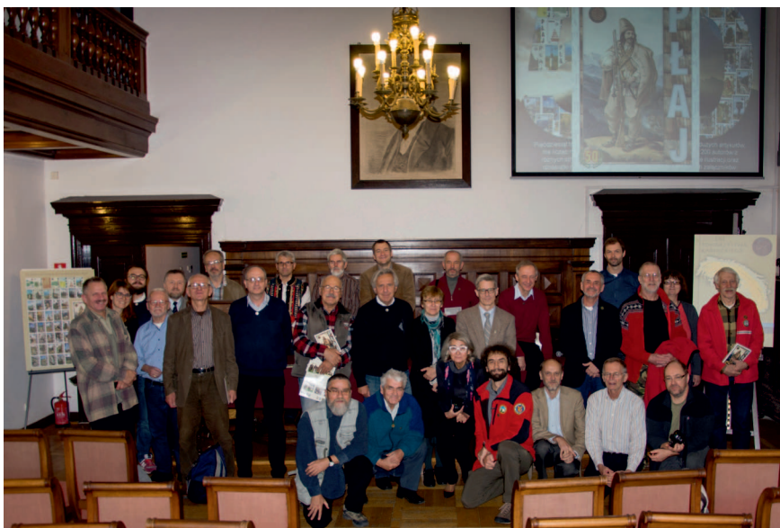
Zebrańie w Instytucie Historii PAN w Warszawie w 2015 r.z okazji 25-lecia TK

Byłem prezesem Towarzystwa Karpackiego na samym początku jego istnienia i także kilkakrotnie później, w sumie przez osiemnaście lat.