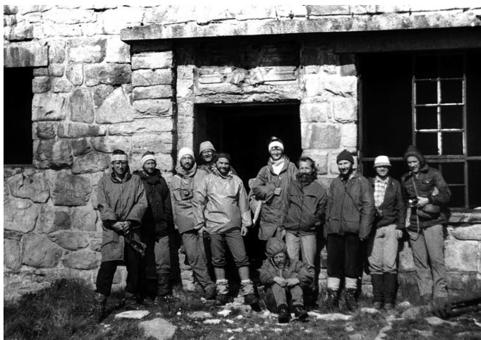
Uczestnicy wyprawy Komisji Wydawniczej SKPB przed ruinami obserwatorium na Popie Iwanie, 1989

Co istotne, turystyka nie była nigdy celem samym w sobie działalności Towarzystwa, raczej jej tłem lub środkiem. Kiedy w 1990 r. zakładaliśmy Towarzystwo Karpackie, każdy z nas miał pewnie trochę inne wyobrażenie o tym, co miało powstać, ale co do jednego byliśmy zgodni, co do tego mianowicie, że ma to być instytucja maksymalnie odbiurokratyzowana i dająca każdemu z nas możliwość realizowania indywidualnych karpackich zainteresowań. Dziś myślę, że ten postulat nasze Towarzystwo spełnia jak dotąd w całej rozciągłości.